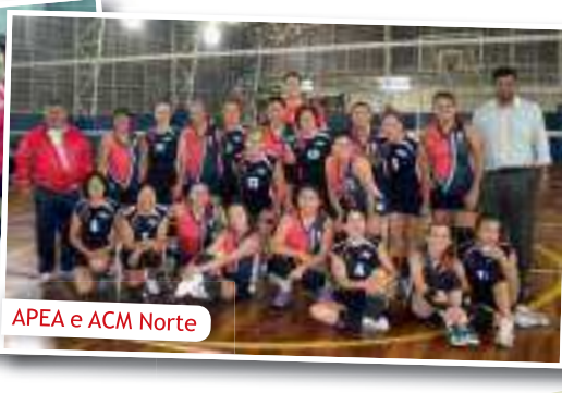
APEA e ACM Norte