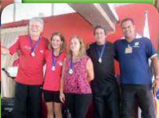
Medalhistas de Vôlei de Areia