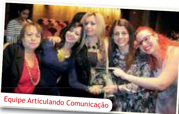
Equipe Articulando Comunicação

A Articulando Comunicação, agência responsável pelo jornal "APEA em Notícias", em 23 de setembro no auditório lotado do SESC Belenzinho, recebeu o 7º Prêmio Gutenberg 2014, sendo uma das contempladas no evento promovido pela Associação Comercial de São Paulo - ACSP. Com o objetivo de destacar os profissionais de imprensa e órgãos de comunicação pelos serviços prestados na mídia, o prêmio proporcionou uma noite inesquecível de encontros, reconhecimentos e emoções para todos os laureados. A APEA, parceira há mais de dez anos da Articulando Comunicação, parabeniza toda a sua equipe e celebra a feliz trajetória, a parceria e o prêmio, com votos de contínua excelência nos serviços prestados.