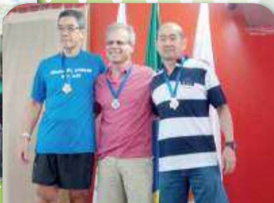
Medalhistas da Corrida de Rua 5km