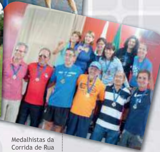
Medalhistas da Corrida de Rua 5km