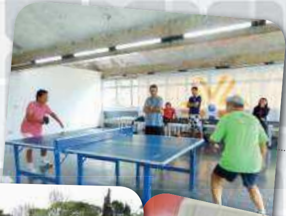
Tênis de Mesa