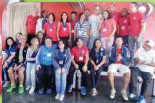
Equipe de organização