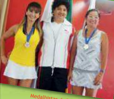
Medalhistas do Tênis de Campo Feminino