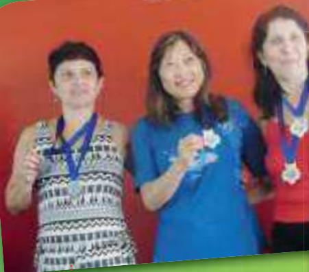
Medalhistas de Natação Feminino