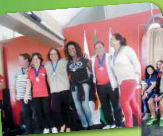
Medalhistas de Dominó