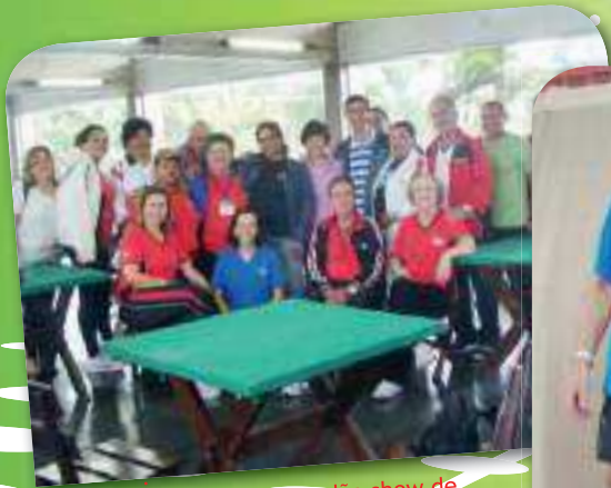
Participantes dão show de animação durante o evento