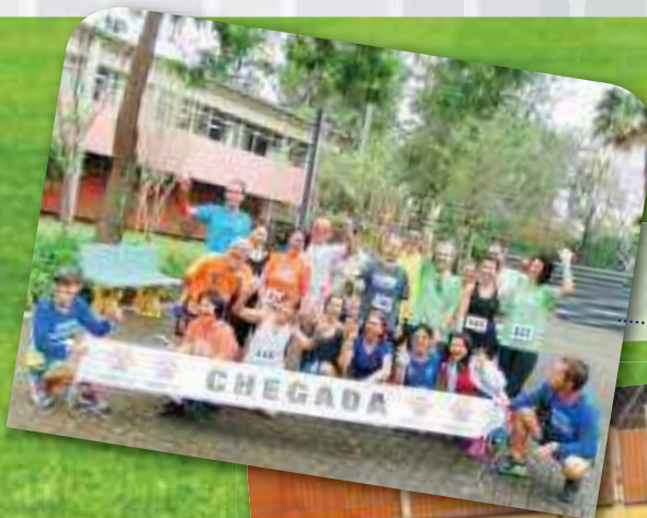
Corrida de Rua 5km

Aguardando a próxima participação no evento esportivo a nível nacional, em Salvador-BA, a APEA/SP parabeniza e agradece a todos participantes do IV Jogos dos Aposentados de São Paulo!