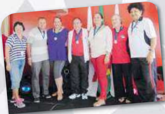
Medalhistas de Canastra