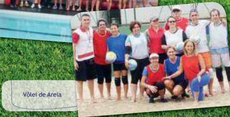
Vôlei de Areia