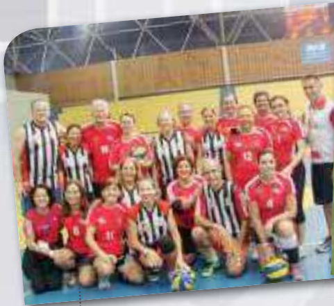
Vôlei de Quadra