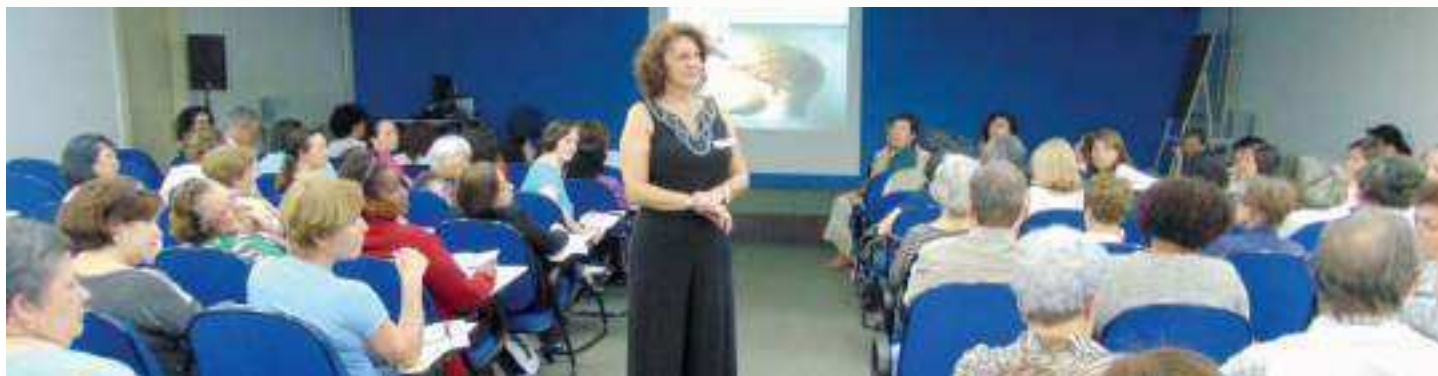
Palestra aborda temas de grande interesse para a saúde física e mental dos participantes