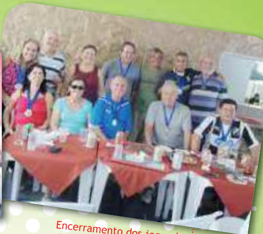
Encerramento dos jogos é celebrado com muita alegria