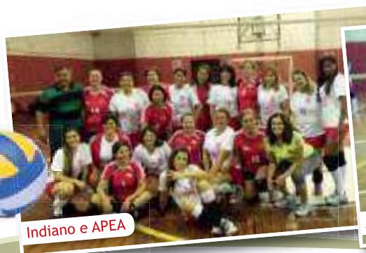
Indiano e APEA

Parabéns a todas as colegas que atuaram com brilhantismo nos jogos.