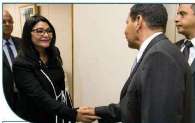
A vice-presidente da FENACEF cumprimenta o General Hamilton Mourão