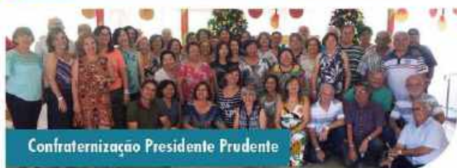
Confraternização Presidente Prudente