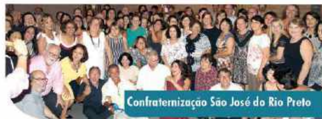
Confraternização São José do Rio Preto