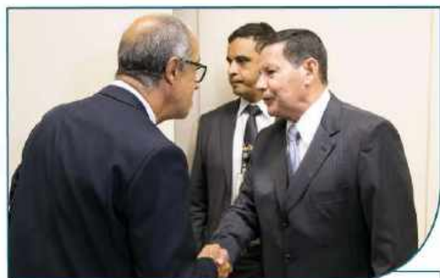
O presidente da FENACEF é recebido pelo vice-presidente da República