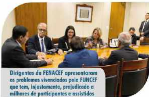
Dirigentes da FENACEF apresentaram os problemas vivenciados pela FUNCEF que tem, injustamente, prejudicado a milhares de participantes e assistidos

A FENACEF é a Federação que agrupa as associações de aposentados da Caixa Econômica Federal.