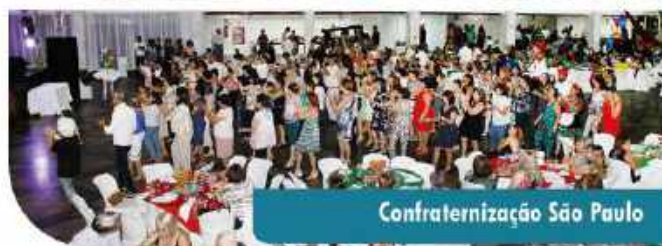
Confraternização São Paulo