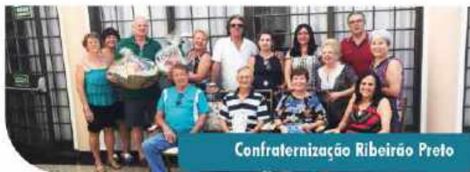
Confraternização Ribeirão Preto