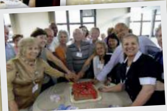
Aniversariantes de agosto/2015