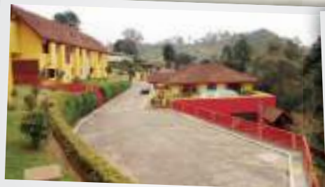
Campos do Jordão