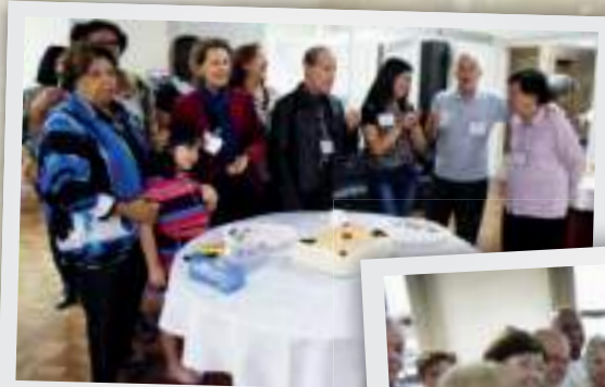
Aniversariantes de julho/2015

Além das felicitações, a Instituição aproveita a oportunidade para expressar sua torcida por mais anos de muita saúde, alegria e amor no coração.