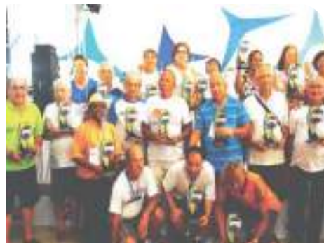
Atletas veteranos e presidentes das AEA's recebem troféus

Foram dias repletos de grandes comemorações. Todas as premiações foram festejadas com alegria e companheirismo. A comissão organizadora contemplou também com troféus os atletas veteranos e todos os presidentes das AEA's.