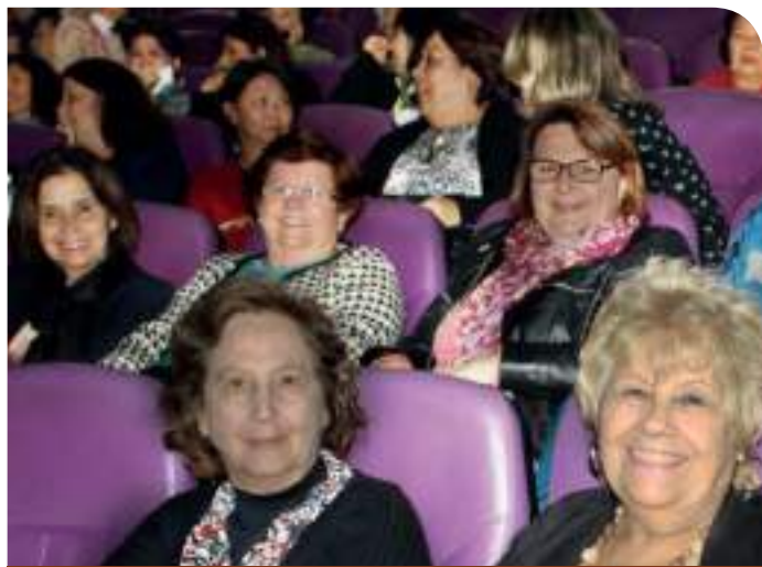
Plenária com cerca de 250 participates

Aos que tiverem interesse em obter informações detalhadas sobre os dados apresentados no evento, solicitar às Associações.