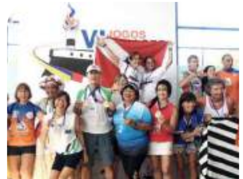
Atletas da Corrida