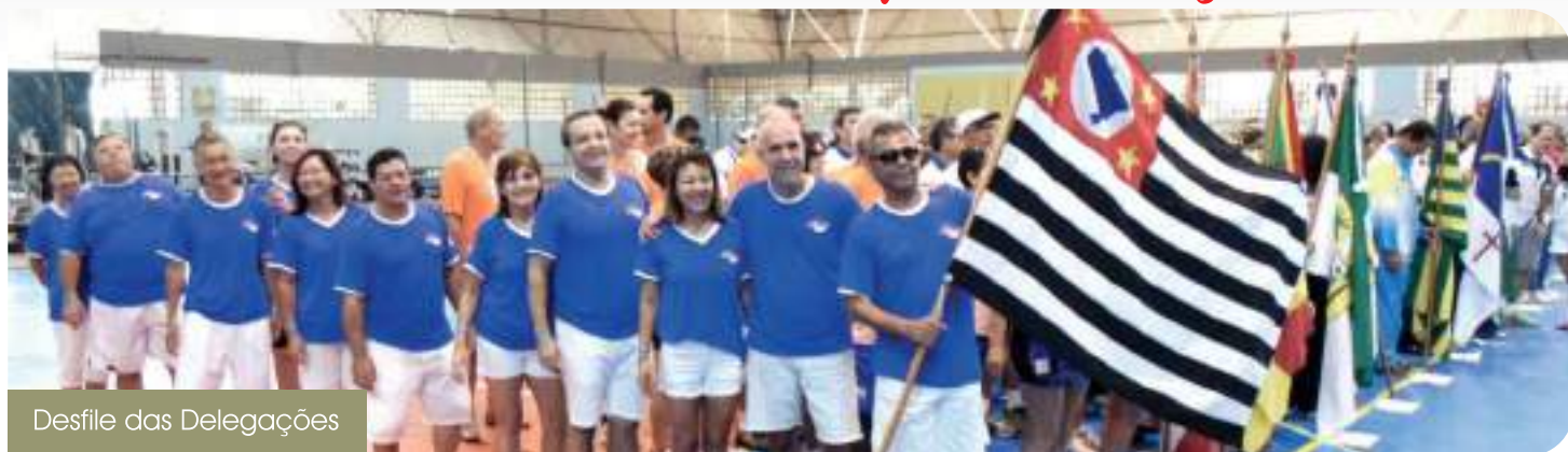
Desfile das Delegações

Aconteceu entre os dias 3 a 9 de maio a sexta edição dos JOGOS FENACEF. O evento esportivo, realizado em Salvador, congregou mais de mil participantes, dentre eles atletas, convidados e componentes das 22 delegações que foram exímios exemplos de energia e espírito esportivo.