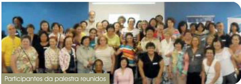
Participantes da palestra reunidos

A APEA/SP, em parceria com a ONG Mãos sem Fronteiras, realizou nos dias 15/04/2015 e 28/04/2015 palestras voltadas ao bem-estar do corpo e mente. Os encontros, promovidos no auditório da GIPES/SP, abordaram o desenvolvimento de posturas no exercício da respiração e relaxamento.