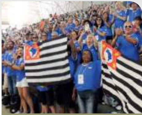
Delegação de São Paulo

Abertura – A solenidade de abertura teve como palco o Ginásio da Associação Atlética Banco do Brasil – AABB.